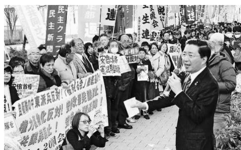
「力を合わせ政権打倒を」と総がかり実行委員会の国会開会日行動(1月20日)