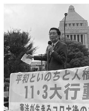
「日本学術会議への政治介入は 民主主義への挑戦」と批判 国会 前行動でスピーチ(11月3日)