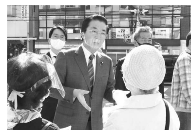
大阪住民投票「なくすな大阪市。 権限・財源の格下げ許すな」と 駆ける(10月25日)