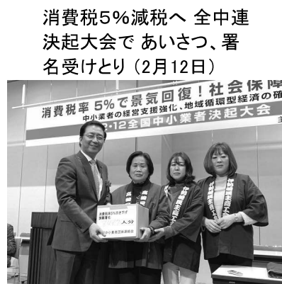
消費税5%減税へ 全中連 決起大会で あいさつ、署名受けとり(2月12日)