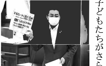
「レベル3」の石綿含有成形板を示し質問（5月28日）