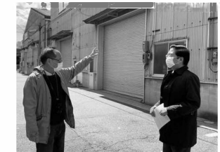
アスベスト飛散に懸念 老朽化工場など調査 大阪・西淀川（4月5日）

山下議員は、5月28日の参院環境委員会で、規制対象となつた「レベル3建材」が古い工場建屋の壁や屋根に大量に使用されており、解体時にアスベストが飛散して、周辺住民や子どもたちがさらされる危険性が高いことを、調査した大阪市西淀川区の実態から告発。事前調査の対象とするだけでなく、解体時の隔離養生、集じん・廃棄装置の設置も義務化すべきと提起。小泉環境相が、義務化は考えていないと述べたのに対し「アスベスト健康被害の一番の教訓は、国が危険性を知りながら規制権限を行使しなかつたことだ」と厳しく批判しました。