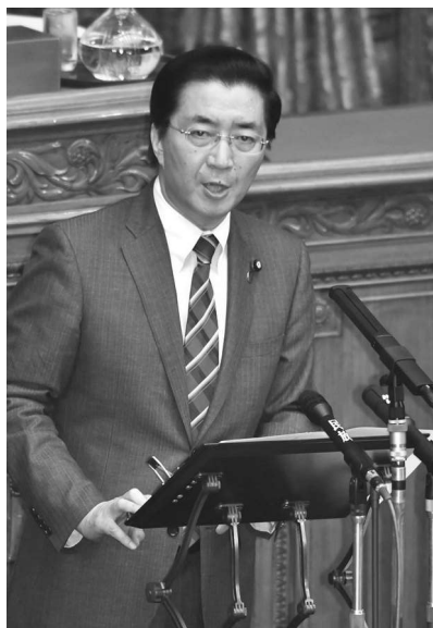
参院本会議で代表質問(1月24日)