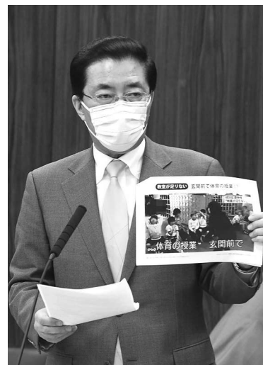
特別支援学校の実態示し質問(11月17日)

こうした運動と国会論戦などに押され、文科省の有識者会議や中央教育審議会は国に設置基準の策定を要求。関係者からは歓迎の声とともに「現状追認でなく、子どもの成長・発達を保障する設置基準を」との声が上がっています。