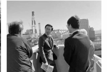
神戸市の神鋼石炭火力を調査（2月25日）