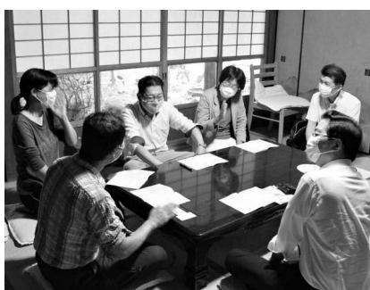
奈良県平群町で入党訴え「働きかけに失敗はない」と実感(7月23日)