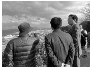
横須賀市の石炭火力を調査 (2月22日)