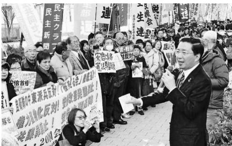
「力を合わせ政権打倒を」と総がかり実行委員会の国会開会日行動(1月20日)