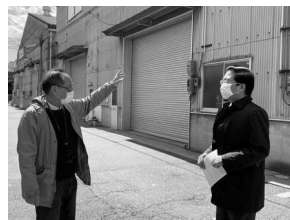
アスベスト飛散に懸念 老朽化工場など調査 大阪・西淀川 (4月5日)