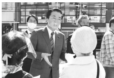
大阪住民投票「なくすな大阪市。権限・財源の格下げ許すな」と駆ける（10月25日）