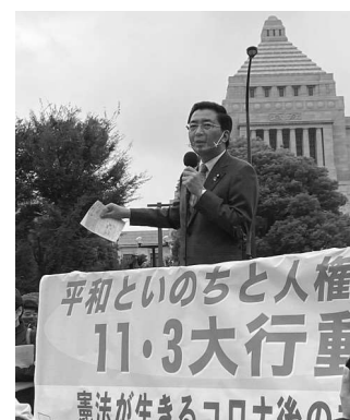
「日本学術会議への政治介入は民主主義への挑戦」と批判 国会前行動でスピーチ（11月3日）