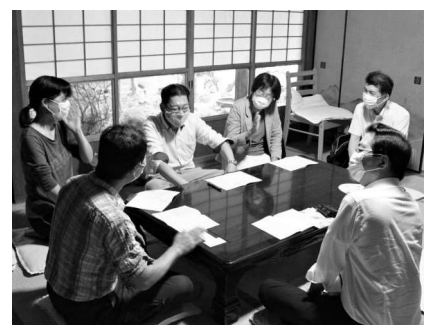
奈良県平群町で入党訴え「働きかけに失敗はない」と実感(7月23日)