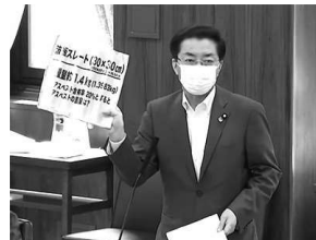
「レベル3」の石綿含有 成形板を示し質問 (5月28日)