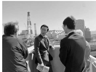
神戸市の神鋼石炭火力を調査 (2月25日)

CO2を大量排出する石炭火力発電所の新規建設が、小泉進次郎環境相の地元神奈川県横須賀市で行われていること