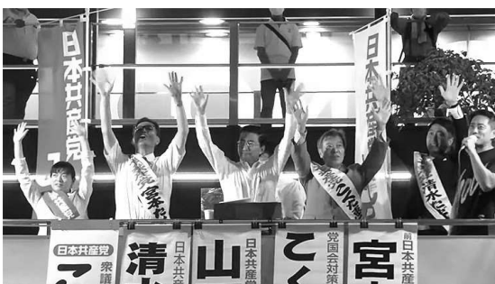
「希望の日本つろう」と大阪で衆院近畿比例4予定候補と訴え（9月11日）

調査でお話を聞いた草津養護学校のPTAの会長さんは「私たちの思いを届けていただき、涙が出るほどうれしかった。18年間運動を続けてきた分離・新設を実現したい」と話しました。同校に23年務めた教員の方は「子どもを大事にする設置基準の必要性を話していただき、非常にうれしい。適正規模で障害種別に応じた設置基準にしてほしい」と語りました。