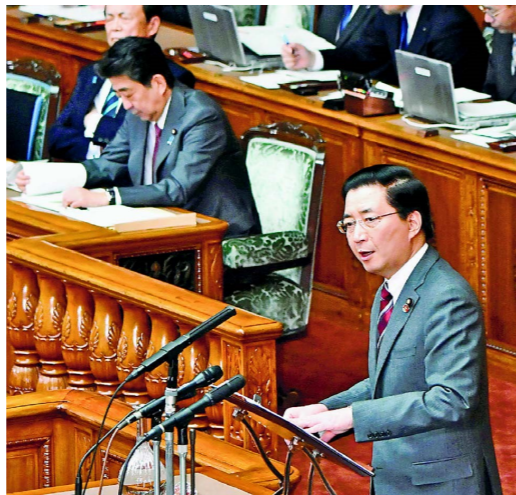
代表質問で安倍首相に迫る(1月24日)