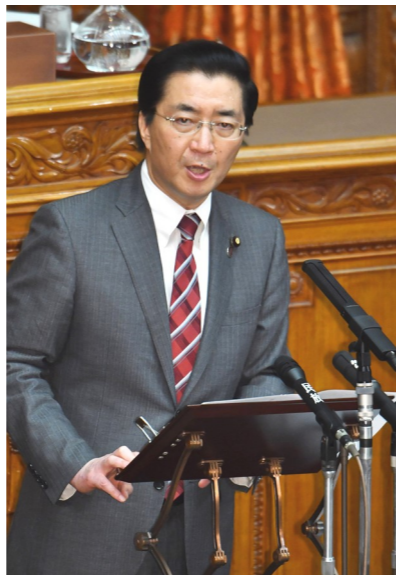
参院本会議で代表質問(1月24日)