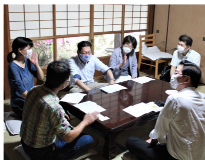
奈良県平群町で入党訴え「働きかけに失敗はない」と実感(7月23日)