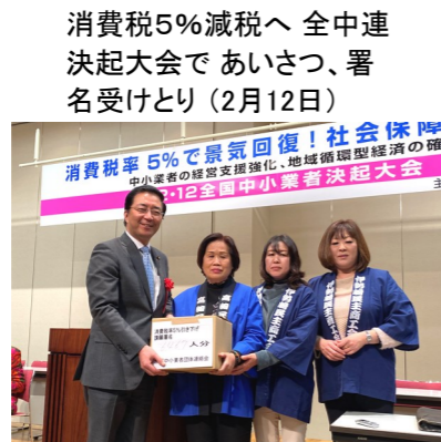
消費税5%減税へ 全中連決起大会で あいさつ、署名受けとり(2月12日)