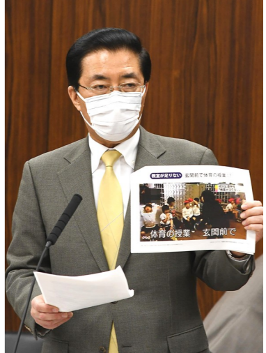
特別支援学校の実態示し質問(11月17日)

「必要」「適正規模で」文科相答弁 運動と論戦で政治動かす 2019年3月、安倍首相に質問。