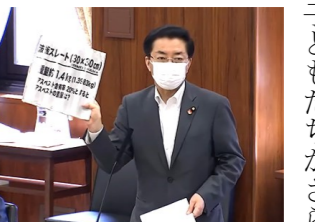
「レベル3」の石綿含有成形板を示し質問（5月28日）