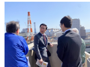
神戸市の神鋼石炭火力を調査（2月25日）