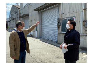
アスベスト飛散に懸念 老朽化工場など調査 大阪・西淀川（4月5日）