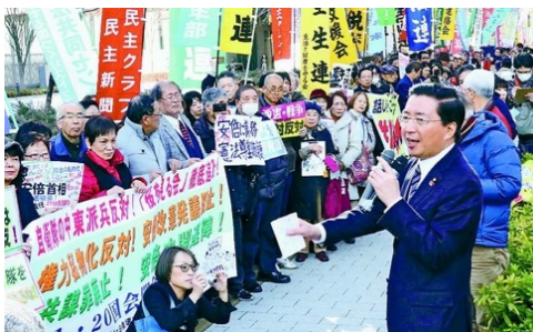
「力を合わせ政権打倒を」と総がかり実行委員会の国会開会日行動(1月20日)