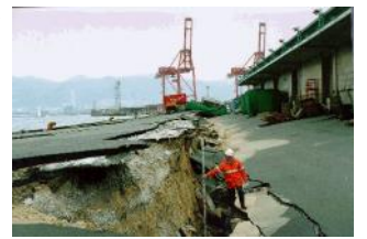
阪神淡路大震災での被害

定地の地層が70m以上の地下深くまで軟弱地盤であることを示し、阪神・淡路大震災で起こった「側方流動」の危険があることを指摘しました。（11月1日、12月6日、環境委）