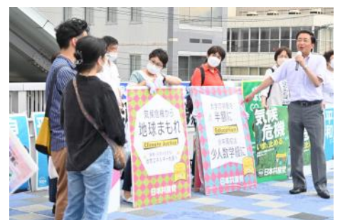
参議院選挙の宣伝で青年の質問に答える(6月25日、大津市・石山駅前)