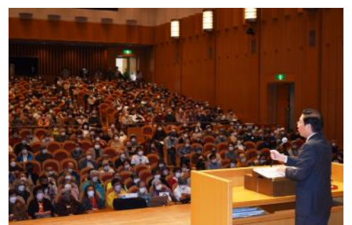
「命・暮らしを守る議席増を」と演説会で訴え(10月29日、奈良県斑鳩町)