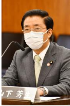
憲法審査会で意見表明(4月27日)

参院の選挙制度について「自民党が党利党略と数の力で自らに有利な制度に改変してきた」と自身の体験もふまえて告発。「参院選挙制度を憲法改定のテコとすることは絶対に許されない」とクギを刺しました。(6月8日、同)