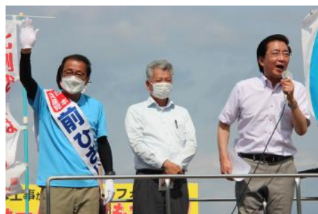
参議院選挙の街頭演説で「外交、9条生かせ」と訴え(6月23日、和歌山県海南市)