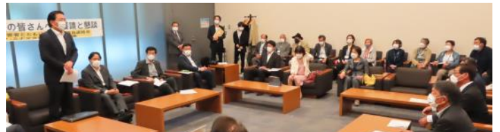
「ノーモア・ミナマタ訴訟原告団・弁護団」と「国会議員連絡会」との懇談に参加（6月9日）