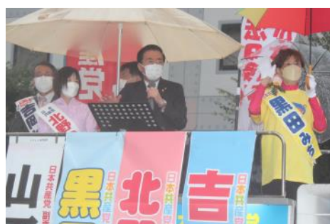
雨の中「市議選必勝を」と訴え(10月9日、兵庫県川西市)