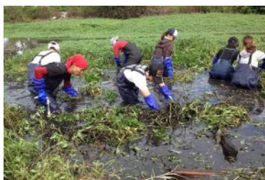
琵琶湖での外来生物防除作業

「地球上で最悪の侵略的植物」とされるナガエツルノゲイトウが淡路島のため池で繁殖し、琵琶湖ではオオバナミズキンバイという外来植物が繁殖。農業や漁業に大きな被害が。山下議員は、多大な労力がかかる駆除作業の実態を紹介。「生物多様性保全のためにも駆除を担う自治体への財政支援が必要」と主張。山口壮環境相は「必要な予算の確保に努める」と答弁。(5月10日、環境委)