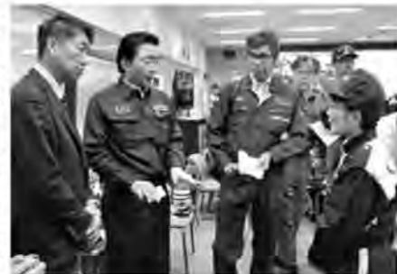
大阪北部地震発生直後に大阪府危機管理センターで開きとり（6月18日）