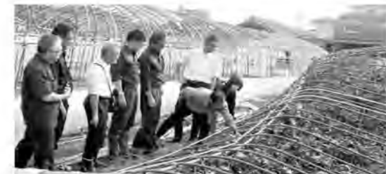
水ナス農家から台風21号被害について聞く（9月7日＝大阪・泉佐野市、左から5人目）

9月、台風21号が関西地方を直撃。記録的な強風と高潮により、住宅被害だけでなく、農業用ハウスがつぶれ、埋め立て地が浸水するなど甚大な被害をもたらしました。 山下議員は、被災地域を歩き、農民連のみなさんと連携して政府に支援を要請。農業用ハウスの再建に、国と自治体で最大9割を負担する支援策が決まり、「これなら前